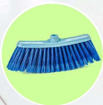
Escobas ver página 29