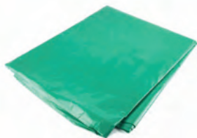
D BOLSAS DE MANIJA