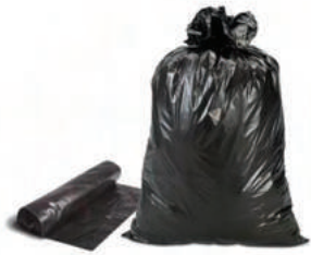
B BOLSA COLOR PUNTO ECOLÓGICO