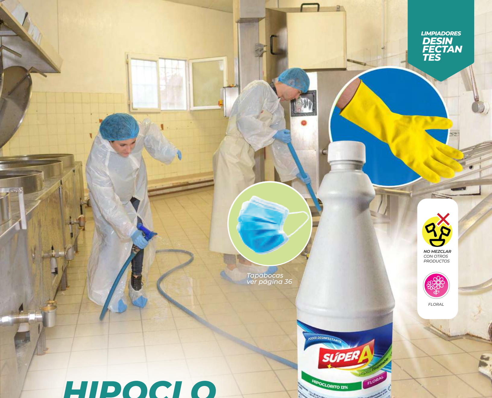
Tapabocas ver página 36