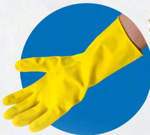
Guantes ver página 35